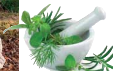
Je gezondheid kruiden