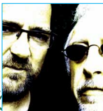
Gedeelde adoraties !!!